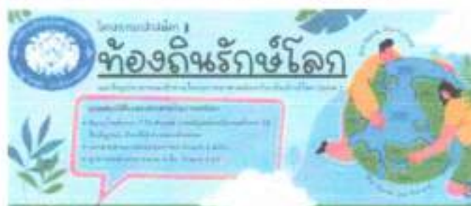
อปต. จันดัด เปิดรับสมัครอาสาสมัครเพื่อสิ่งแวดล้อม (อปต.)

รับสมัคร ตั้งแต่บัดนี้เป็นต้นไป เวลา 08.30-16.30 น. สำนักงาน องค์การบริหารส่วนตำบลจันดัด