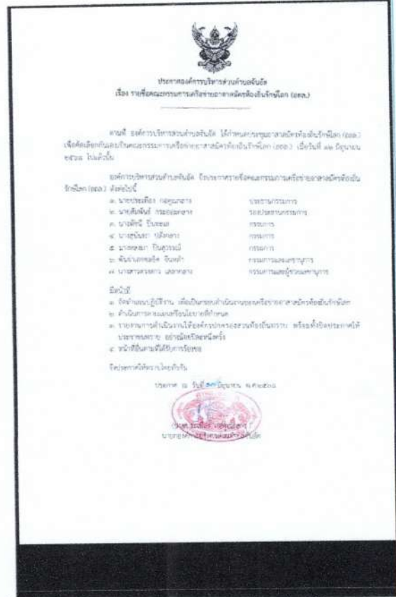
ประกาศองค์การบริหารส่วนตำบลจันอัด เรื่อง รายชื่อคณะกรรมการเครือข่ายอาสาสมัครท้องถิ่นรักโลก (อกล.)

วันที่ลงข่าว : 17 มิ.ย. 2568 ผู้ลงข่าว : อบต.จันอัด