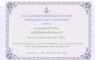
เกียรติบัตร ชั้นที่ 2