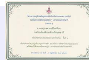
เกียรติบัตร ชั้นที่ 1