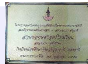
ป้ายสนองพระราชดำริฯ